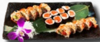
Menü 8 1 Misosuppe, 8 Sake Maki, 5 California IO, 5 Sake IO