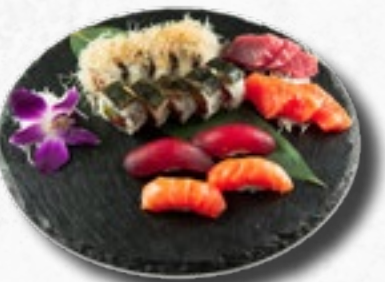
Menü 19 27,50 1 Misosuppe, 5 Sakura Rolls, 5 Dynamite Tuna Rolls, 4 Nigiri (2 Sake, 2 Maguro), 6 Sashimi vom Lachs und Thunfisch