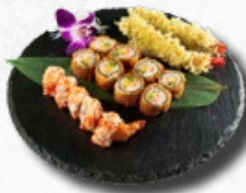
Menü 14 17,50 1 Misosuppe, 5 Ebi Tempura Rolls, 2 Ebi Tempura, 8 gebackene Salmon