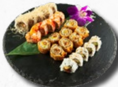
Menü 18 20,50 1 Misosuppe, 5 Chicken Rolls, 5 Yakitori IO, 5 Ebi Tempura Rolls, 8 gebackene Chicken