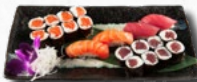
Menü 10 1 Misosuppe, 8 Sake Maki, 8 Tekka Maki, 4 Nigiri (2 Sake, 2 Maguro)