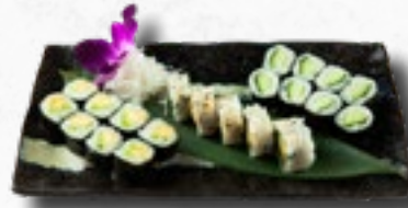
Menü 2 1 Misosuppe, 8 Kappa Maki, 8 Avocado Maki, 5 Yegeta IO