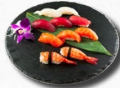
Menü 15 17,00 1 Misosuppe, 10 Nigiri (3 Sake, 3 Maguro, 2 Ebi, 2 Butterfisch)