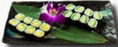
Menü 1 1 Misosuppe, 8 Kappa Maki, 8 Avocado Maki