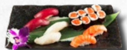
Menü 12 1 Misosuppe, 8 Sake Maki, 6 Nigiri (2 Sake, 2 Maguro, 2 Aal)