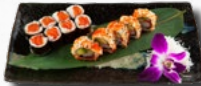
Menü 5 1 Misosuppe, 8 Sake Maki, 5 California IO