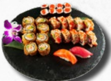
Menü 16 20,50 1 Misosuppe, 8 Sake Maki, 5 California IO, 5 Sake IO, 2 Nigiri (1 Sake, 1 Maguro), 8 gebackene Salmon