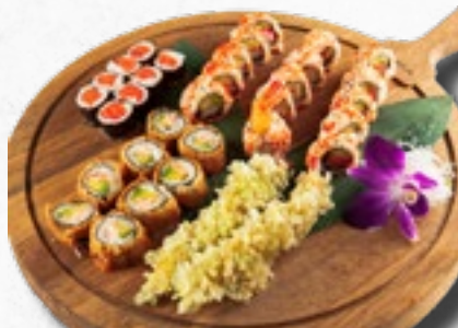
Menü 20 29,50 2 Misosuppen, 8 Sake Maki, 5 California IO, 5 Sake IO, 5 Ebi Tempura Rolls, 2 Ebi Tempura, 8 gebackene Salmon