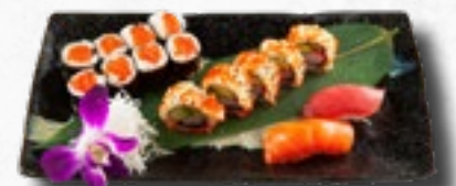
Menü 9 1 Misosuppe, 5 California IO, 8 Sake Maki, 2 Nigiri (1 Sake, 1 Maguro)