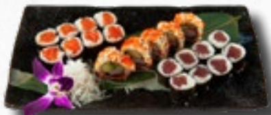
Menü 7 1 Misosuppe, 8 Sake Maki, 8 Tekka Maki, 5 California IO