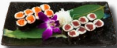
Menü 4 1 Misosuppe, 8 Sake Maki, 8 Tekka Maki