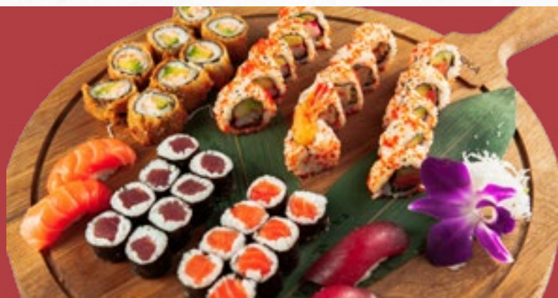
Menü 22 40,50 2 Misosuppen, 4 Nigiri (2 Sake, 2 Maguro), 8 Sake Maki, 8 Tekka Maki, 5 California IO, 5 Sake IO, 5 Ebi Tempura Rolls, 8 gebackene Salmon