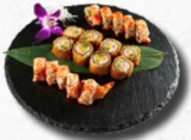
Menü 13 16,80 1 Misosuppe, 5 Ebi Tempura Rolls, 5 California IO, 8 gebackene Salmon