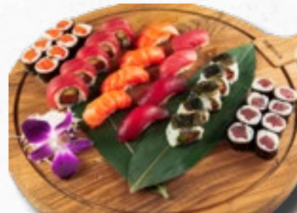
Menü 21 39,50 2 Misosuppen, 8 Nigiri (4 Sake, 4 Maguro), 8 Sake Maki, 8 Tekka Maki, 5 Sakura Rolls, 5 Philadelphia Rolls