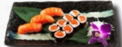
Menü 6 1 Misosuppe, 8 Sake Maki, 3 Sake Nigiri