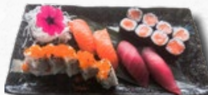
Menü 11 1 Misosuppe, 8 Sake Maki, 5 California IO, 4 Nigiri (2 Sake, 2 Maguro)