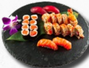
Menü 17 20,50 1 Misosuppe, 8 Sake Maki, 5 California IO, 4 Nigiri (2 Sake, 2 Maguro), 5 Ebi Tempura Rolls